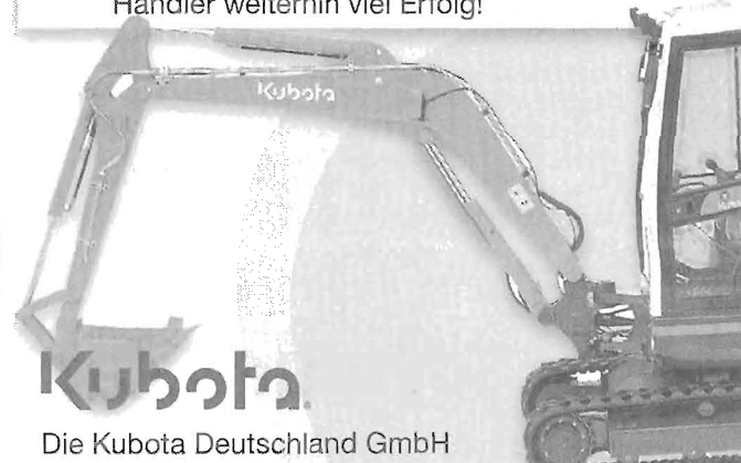
Die Kubota Deutschland GmbH

Wir wünschen unserem erfolgreichen Händler weiterhin viel Erfolg!