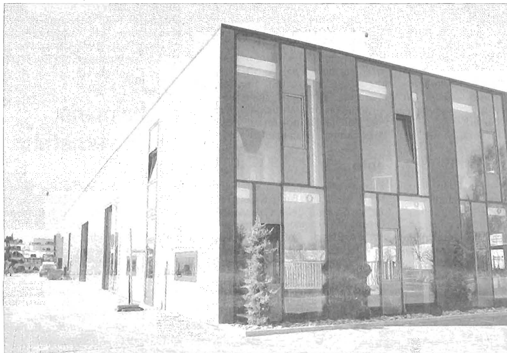
Elegant fügt sich das neue Gebäude in seine Umgebung ein.